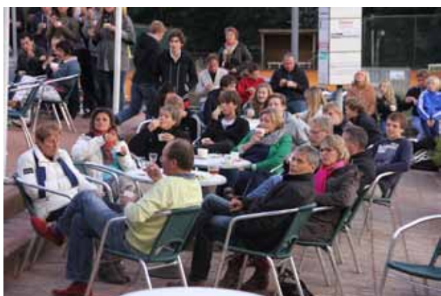
Een vol terras op de feestelijke zaterdagavond.