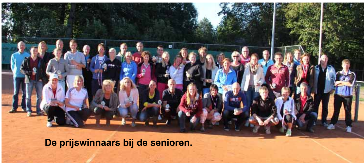
De prijswinnaars bij de senioren.