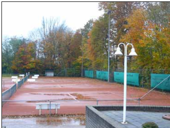
Herfst op het DLTC-park. Kijk even voor de prachtige kleuren op www.dltc.nl .

Verder is er gesproken over de toekomst van het clubblad. Redactie en bestuur zijn het eens dat we vaker digitaal gaan communiceren. Het aantal nummers van het clubblad zal geleidelijk teruggebracht worden.