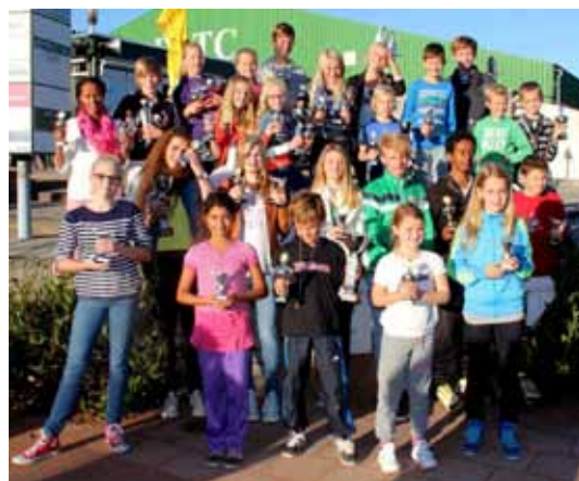
De prijswinnaars bij de jeugd